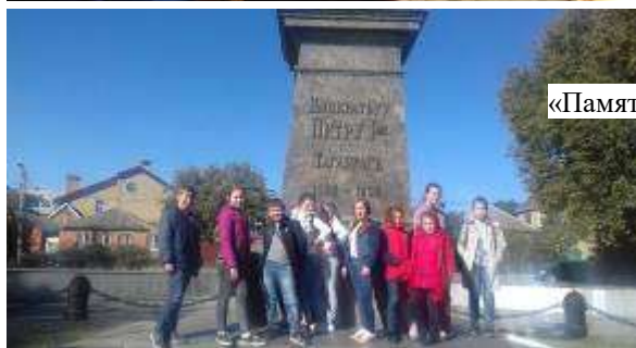
«Памятник Петра 1, основатель города Таганрог»