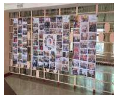
Комплекс «Память поколений».