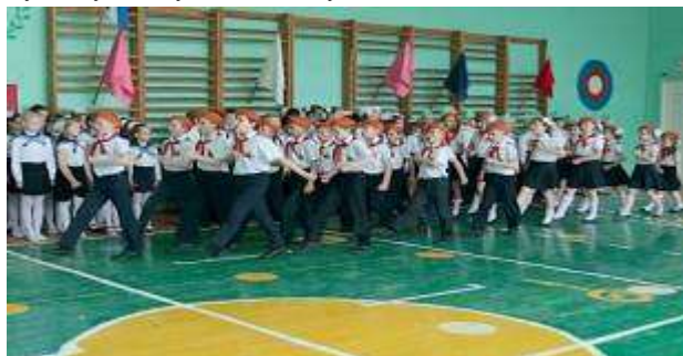
Военно-спортивная игра «Звездочка»

Прежде всего, это «Звездочка», «Зарница» и «Рубеж», которые в комплексе решают задачи почти всех компонентов системы военно-патриотического воспитания. Практическая значимость игр четко прослеживается с помощью обратной связи «ШКОЛА – АРМИЯ». Опыт проведения игр «Звездочка» «Зарница» «Рубеж» показал популярность и важность этой формы военно-патриотического и физического воспитания обучающихся, оказывает положительное влияние на организационное укрепление коллектива класса, способствует развитию общественной активности детей, формирует качества, необходимые будущему воину, защитнику Родины.