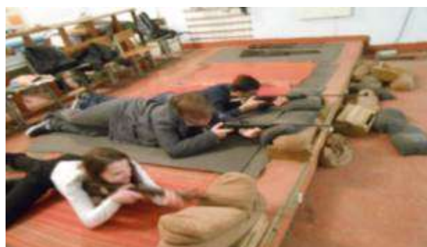
Тренировка меткости стрельбы в школьном тире.