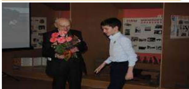
Урок Мужества в музее школы