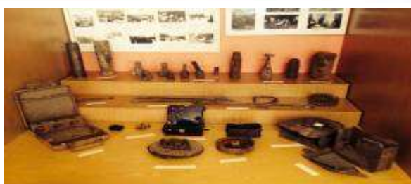
Уголок экспонатов военных предметов.