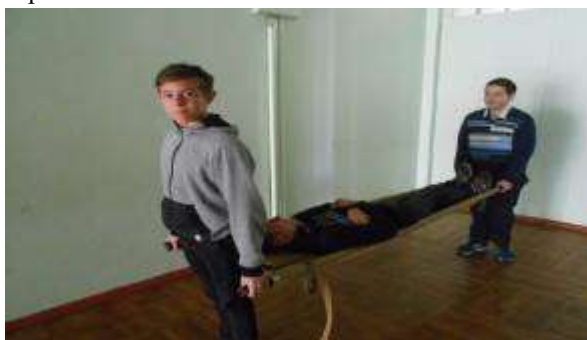
Оказание первой помощи пострадавшему.

Во главе всего воспитательного процесса стоит урок, внеклассная и внешкольная работы с обучающимися по военно-патриотическому воспитанию. Каждый общеобразовательный предмет объективно располагает большим патриотическим потенциалом. Специальный раздел в предмете ОБЖ – ОСНОВЫ ВОЕННОЙ СЛУЖБЫ призван закрепить уже имеющиеся у обучающихся знания по допризывной подготовке, привести их в систему, дополнив новыми знаниями, научить применять на практике, полученные на уроках знания и умения – иными словами, сформировать умения и навыки военно-прикладного характера.