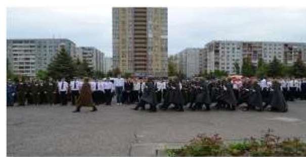
Месячник оборонно-массовой и спортивно-оздоровительной работы