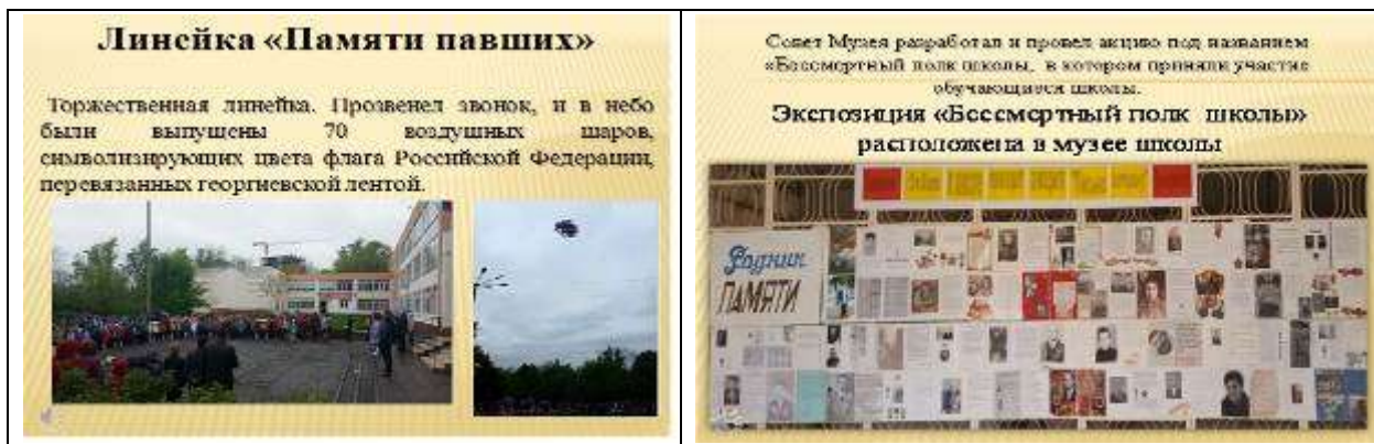
6. Участие в прохождении колонны г. Ростова-на-Дону «Бессмертный полк» 9 мая 2018 года.