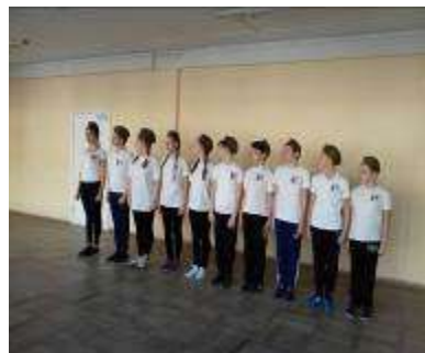
Военно-спортивная игра «Зарница»