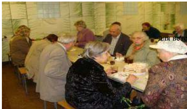
Поздравление с праздником и сладкий стол для ветеранов.