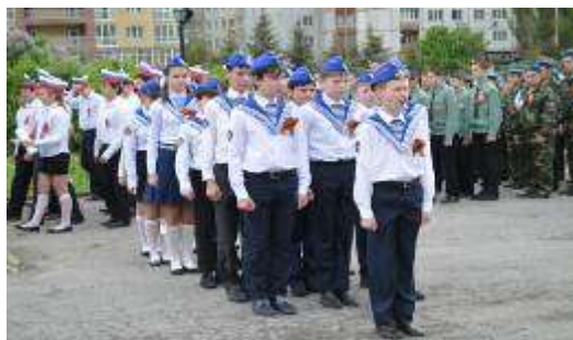
Военно-спортивная игра «Рубеж»