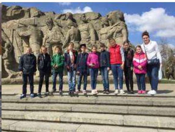
Экскурсия в город Волгоград.