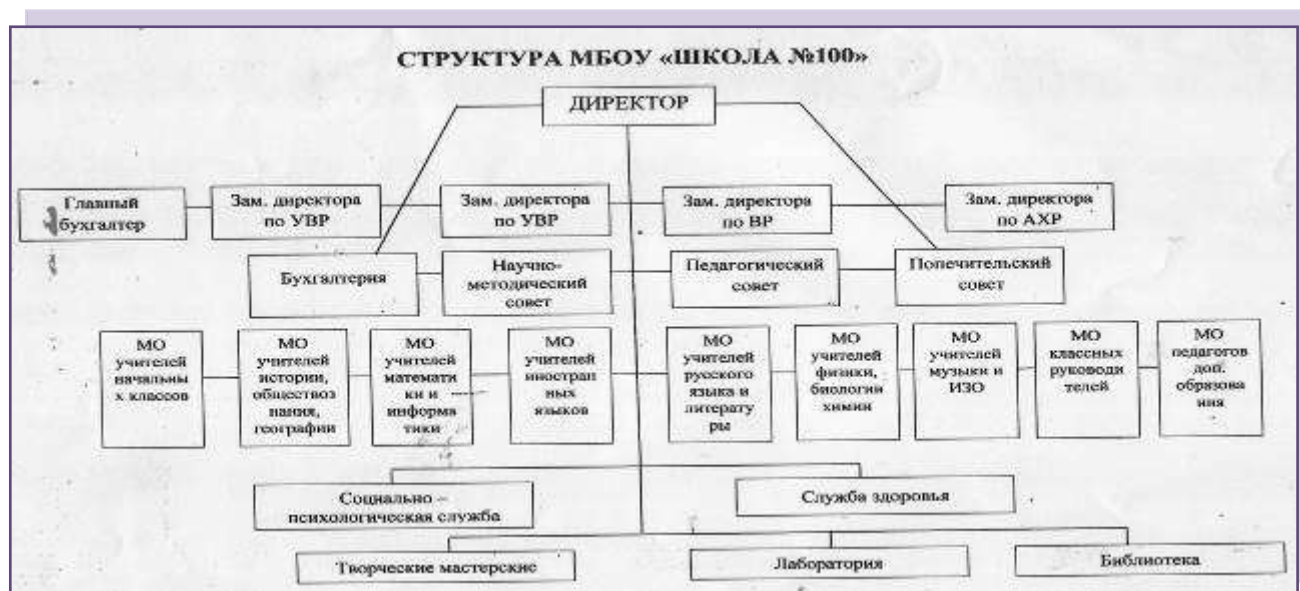
Данные о специалистах курирующих вопросы воспитания (педагог-организатор, педагог-психолог)