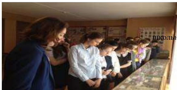
Проведение экскурсий обучающихся в школьном музее.