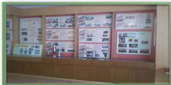
Музей истории школы №100

Кабинет ОБЖ, музей школы №100 является воспитательным центром военно-патриотической работы. Наличие в школе подобного воспитательного центра военно-патриотической работы способствует приданию всей проводимой работе системности, закреплению позитивных традиций. В музее школы №100 помещены материалы по поисковой работе, способствующие воспитанию школьников на героических традициях старших поколений.