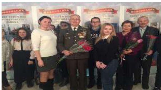
Встречи с ветеранами.