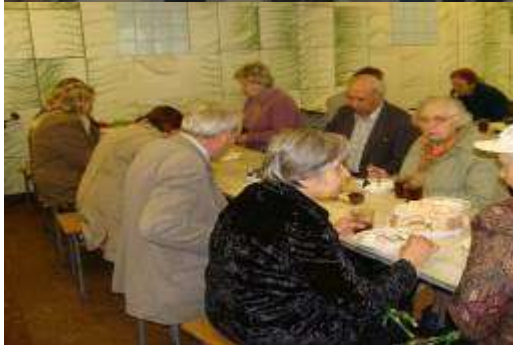
Поздравление с праздником и сладкий стол для ветеранов.