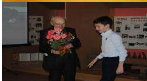
Урок Мужества в музее школы