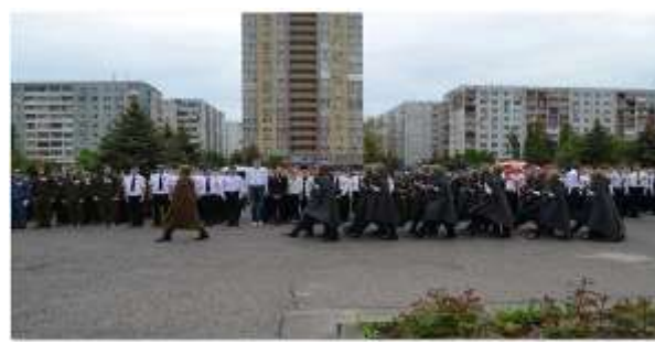
Месячник оборонно-массовой и спортивно-оздоровительной работы