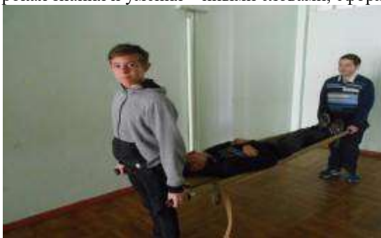
Оказание первой помощи пострадавшему.

Во главе всего воспитательного процесса стоит урок, внеклассная и внешкольная работы с обучающимися по военно-патриотическому воспитанию. Каждый общеобразовательный предмет объективно располагает большим патриотическим потенциалом. Специальный раздел в предмете ОБЖ – ОСНОВЫ ВОЕННОЙ СЛУЖБЫ призван закрепить уже имеющиеся у обучающихся знания по допризывной подготовке, привести их в систему, дополнив новыми знаниями, научить применять на практике, полученные на уроках знания и умения – иными словами, сформировать умения и навыки военно-прикладного характера.