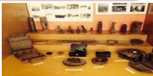
Уголок экспонатов военных предметов.