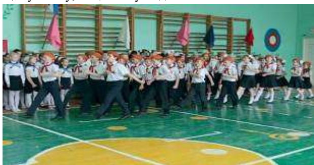
Военно-спортивная игра «Звездочка»

Прежде всего, это «Звездочка», «Зарница» и «Рубеж», которые в комплексе решают задачи почти всех компонентов системы военно-патриотического воспитания. Практическая значимость игр четко прослеживается с помощью обратной связи «ШКОЛА – АРМИЯ». Опыт проведения игр «Звездочка» «Зарница» «Рубеж» показал популярность и важность этой формы военно-патриотического и физического воспитания обучающихся, оказывает положительное влияние на организационное укрепление коллектива класса, способствует развитию общественной активности детей, формирует качества, необходимые будущему воину, защитнику Родины.