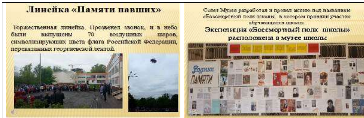
6. Участие в прохождении колонны г. Ростова-на-Дону «Бессмертный полк» 9 мая 2018 года.