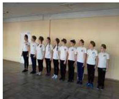
Военно-спортивная игра «Зарница»