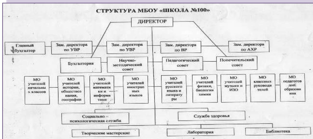
Данные о специалистах курирующих вопросы воспитания (педагог-организатор, педагог-психолог)