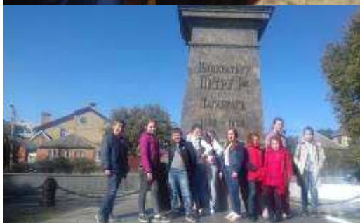
«Памятник Петра 1, основатель города Таганрог»