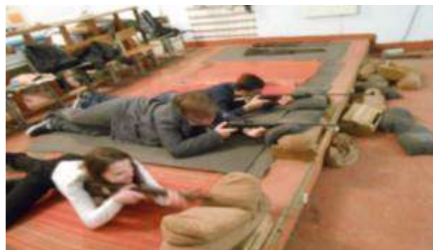
Тренировка меткости стрельбы в школьном тире.