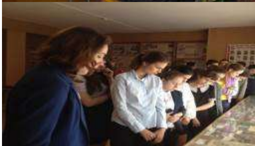
Проведение экскурсий обучающихся в школьном музее.