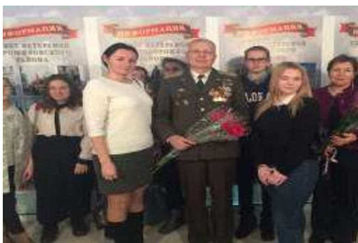
Встречи с ветеранами.