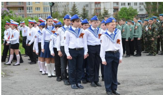
Военно-спортивная игра «Рубеж»