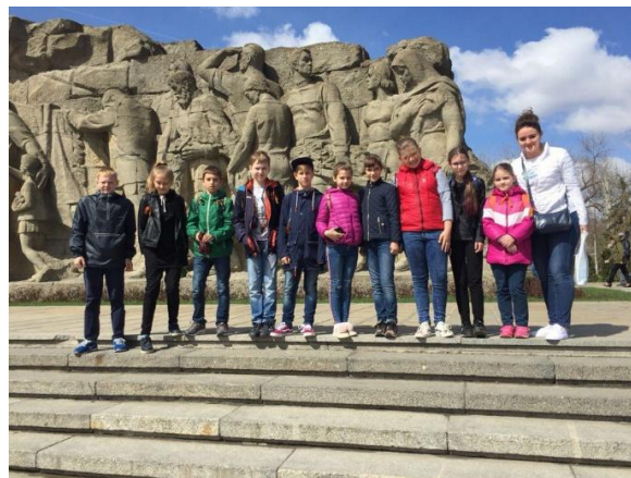
Экскурсия в город Волгоград.