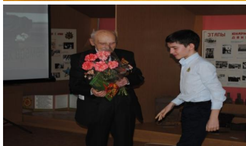
Урок Мужества в музее школы