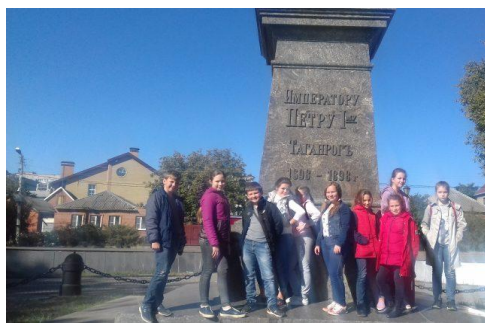
«Памятник Петра 1, основатель города Таганрог»