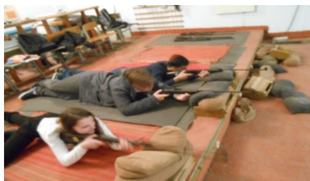
Тренировка меткости стрельбы в школьном тире.

Кабинет ОБЖ, музей школы №100 является воспитательным центром военно-патриотической работы. Наличие в школе подобного воспитательного центра военно-патриотической работы способствует приданию всей проводимой работе системности, закреплению позитивных традиций. В музее школы №100 помещены материалы по поисковой работе, способствующие воспитанию школьников на героических традициях старших поколений.