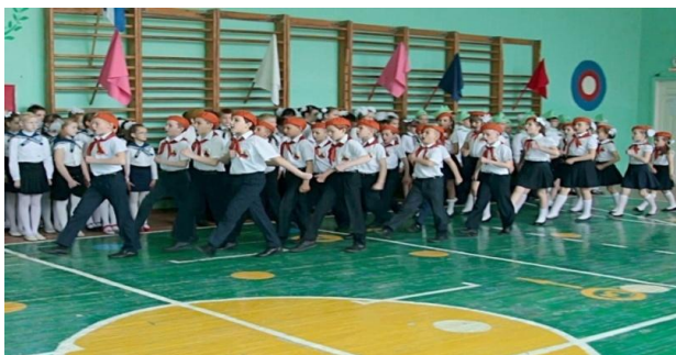
Военно-спортивная игра «Звездочка»