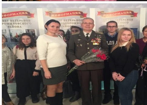
Встречи с ветеранами.