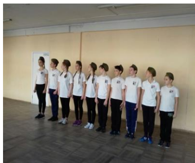
Военно-спортивная игра «Зарница»