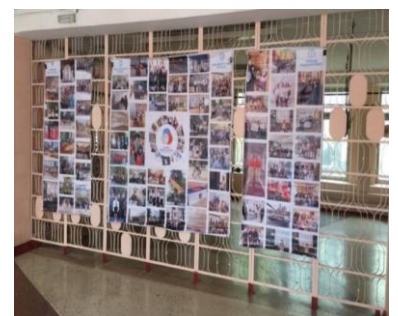
Комплекс «Память поколений».

2 Проведение экскурсий, уроков Мужества, встреч с ветеранами Великой Отечественной войны.