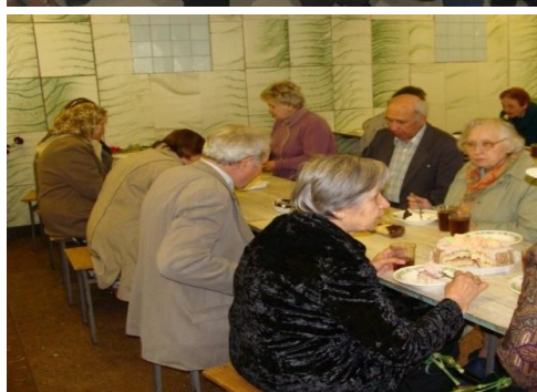
Поздравление с праздником и сладкий стол для ветеранов.