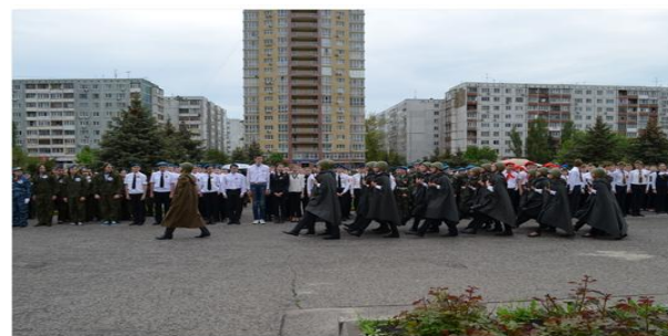
Месячник оборонно-массовой и спортивно-оздоровительной работы