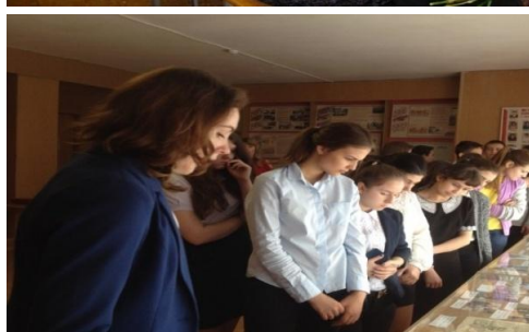
Проведение экскурсий обучающихся в школьном музее.