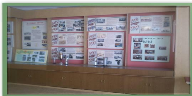
Музей истории школы №100

Кабинет ОБЖ, музей школы №100 является воспитательным центром военно-патриотической работы. Наличие в школе подобного воспитательного центра военно-патриотической работы способствует приданию всей проводимой работе системности, закреплению позитивных традиций. В музее школы №100 помещены материалы по поисковой работе, способствующие воспитанию школьников на героических традициях старших поколений.