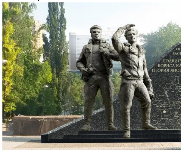
Проект памятника, который будет установлен в Ростове-на-Дону, в честь летчиков-героев Капустина Б.В. и Янова Ю.Н.

5. Проведение конкурсов военно-патриотической песни, а также других праздничных мероприятий (концертов) посвященных великим праздникам.