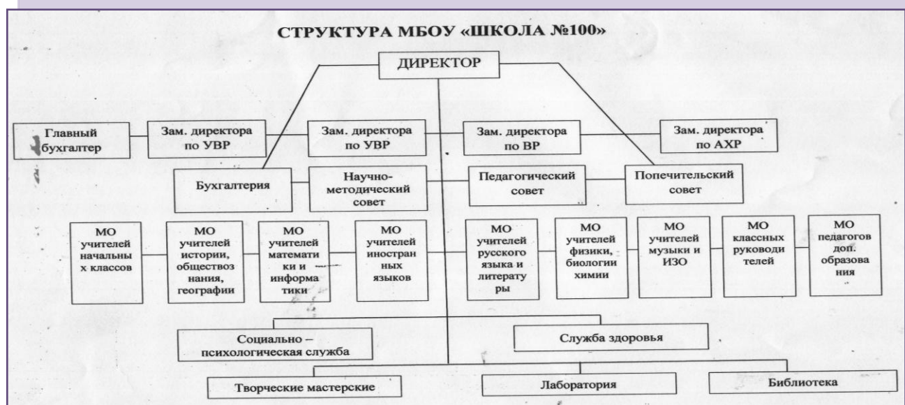
Данные о специалистах курирующих вопросы воспитания (педагог-организатор, педагог-психолог)