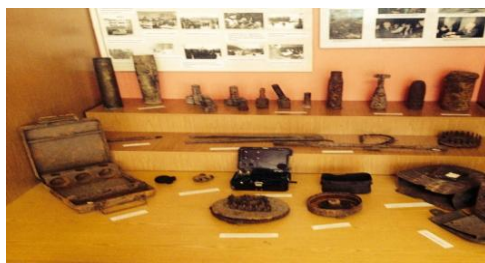
Уголок экспонатов военных предметов.